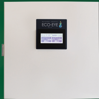
快適性を損わず、最大デマンド値を抑えて 契約電力を下げる『ECO-EYE』 写真：室外機16台タイプ